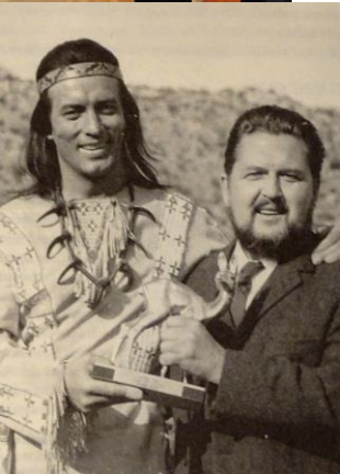
Horst Wendlandt (r.) mit Pierre Brice